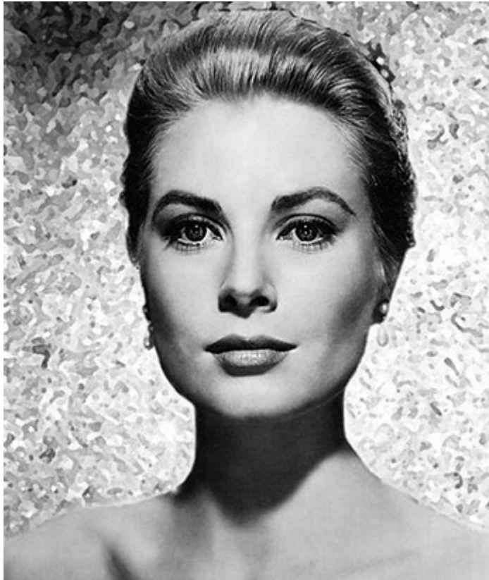
Αύγουστος: ( Grace Kelly )