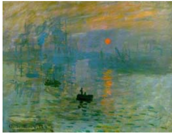
Claude Monet, Impression, soleil levant

( http://upload.wikimedia.org/wikipedia/commons/5/5c/Claude_Monet%2C_Impression%2C_soleil_levant%2C_1872.jpg )